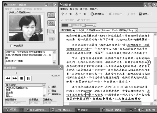
圖 4 線上公民會議開會狀況與軟體介面