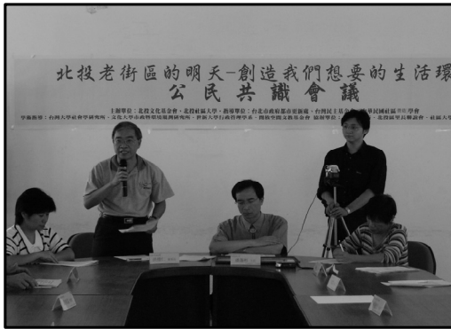
圖 3 實體公民會議開會情形